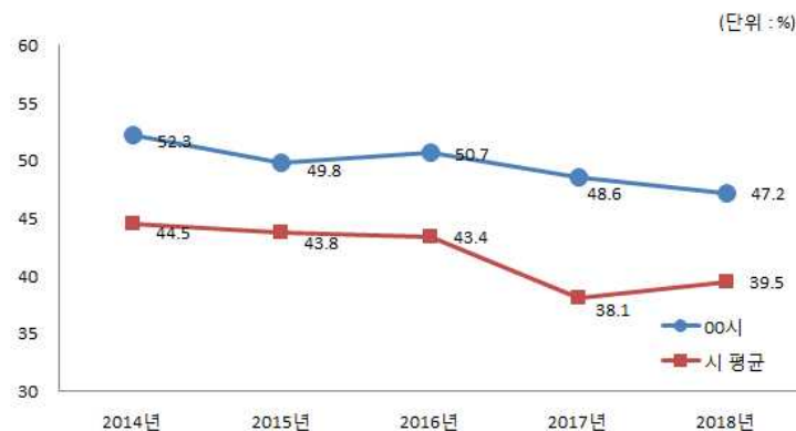
유사 지방자치단체와 재정자립도 비교